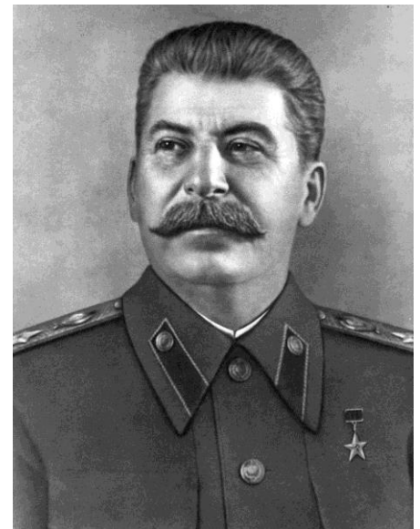
ПОБЕДА БУДЕТ ЗА НАМИ!

Классовый враг силен только нашей неорганизованностью и поэтому объективно его гибель предрешена!