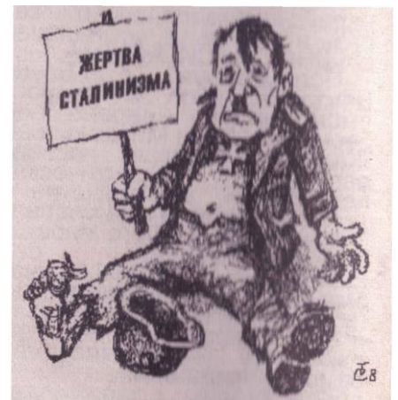
Газета «Совет рабочих депутатов» №1(47), 2010 г.

В своем недавнем выступлении, широко озвученном буржуазными средствами массовой информации, президент России Медведев заявил, что